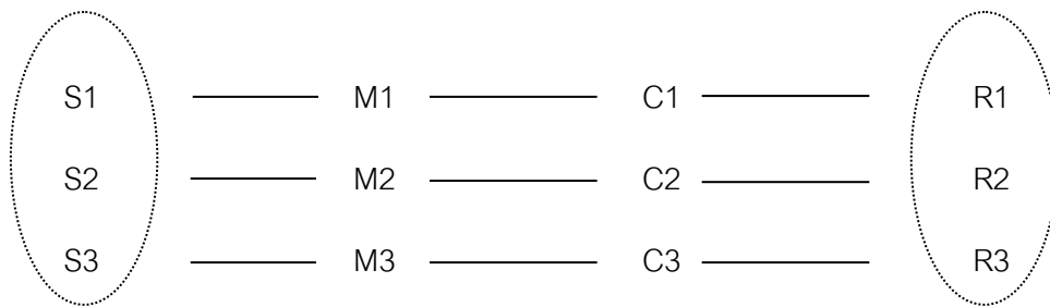
ภาพที่ 2 : ความหลากหลายในองค์ประกอบของการสื่อสาร